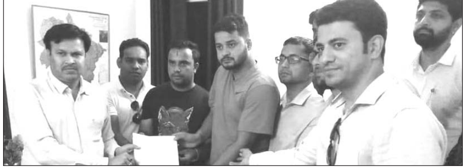
उपजिलाधिकारी को ज्ञापन सौंपते कार्यकर्ता

बागेश्वर। पश्चिमी बंगाल में भाजपा कार्यकर्ताओं पर हो रहे जानलेवा हमले पर भाजपाइयों में भारी रोष है। उन्होंने राष्ट्रपति को संबोधित ज्ञापन मंगलवार को एसडीएम को सौंपा। कहा कि कार्यकर्ताओं से अपभ्रता करने वालों के खिलाफ सख्त कार्रवाई तय होनी चाहिए। भारतीय युवा मोर्चा के