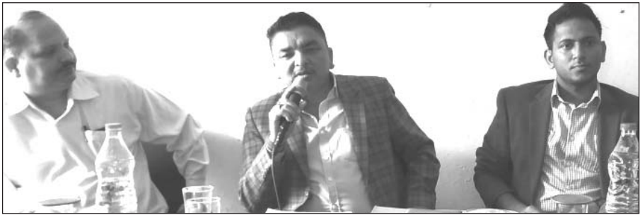
जिला विकास प्राधिकरण की बैठक में मौजूद लोग

अपर जिलाधिकारी ने संबंधित विभागों के अधिकारियों को निर्देश दिये कि जिन विभागों ने अनापत्ति प्रमाण पत्र नहीं दिये हैं, वे तय समय में अनापत्ति प्रमाणपत्र जारी कर दें। उन्होंने कहा कि यदि आवेदन पत्र में कोई कमी रहती है तो तत्काल इस बारे में आवेदक को बताया जाए