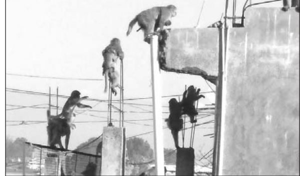
बाजार क्षेत्र में उपात मचाते उपाती बन्दर

गरुड़। तहसील के दर्जनों गांवों में बन्दरों का आतंक जारी है। क्षेत्र में सैकड़ों लोगों को कटखने बन्दर अभी तक घायल कर चुके हैं। बन्दरों का रुख ग्रामीण क्षेत्र में फसल की कटाई होने के बाद अब बाजार क्षेत्र