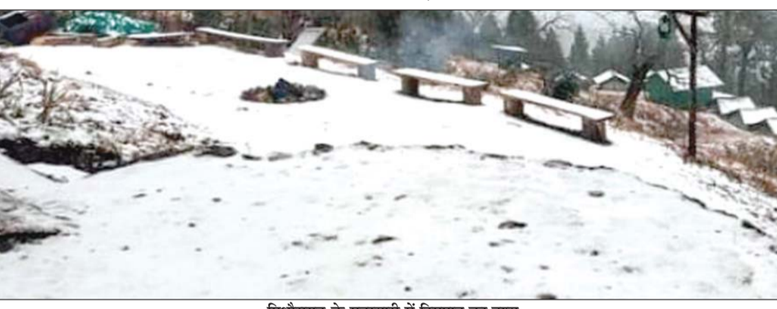
पिथौरागढ़ के मुनस्यारी में हिमपात का दृश्य